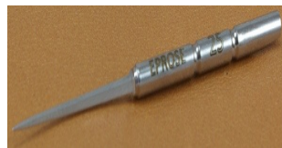
Fer d'alène losangique amovible 25mm